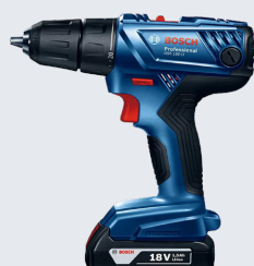
PARAFUSADEIRA E FURADEIRA 180 18 W BOSCH