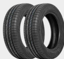
PNEU MICHELIN 175/70 R14 ENERGY