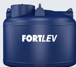
CAIXA D'ÁGUA TANQUE FORTLEV 5.000 L