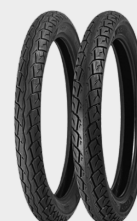
PNEU MOTO 90/90/18 MATRIX CG LEVORIN