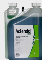
ACIENDEL POUR-ON PLUS 1L