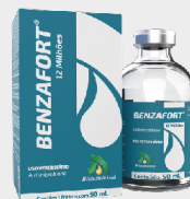
BENZAFORT 12 MILHÕES 50 ML