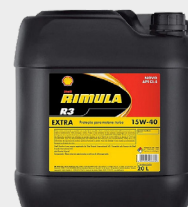
OLEO SHELL RIMULA X 20L 500H RT 4X