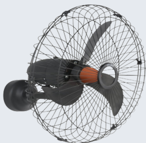
VENTILADOR PAREDE 70 CM - GO AR