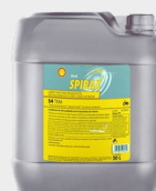
OLEO SHELL SPIRAX S4 TXM 20 L