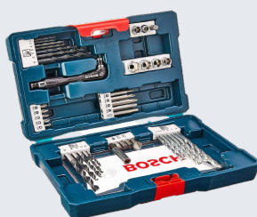
CONJUNTO BROCA E BITS BOSCH 41 PC