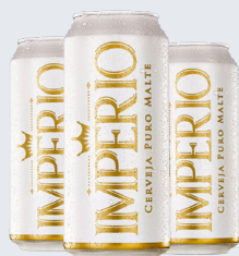
CERVEJA IMPÉRIO PURO MALTE 473 ML