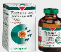
TOLFEDINE CS 100 ML