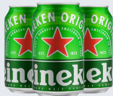
CERVEJA HEINEKEN LT 350 ML