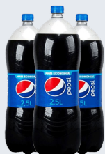
REFRIGERANTE PEPSI 2,5L