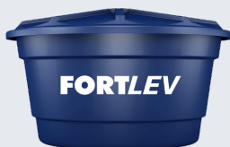
CAIXA D'ÁGUA FORTLEV 1.000 L