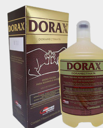
DORAX INJETAVEL 500ML