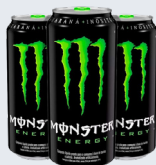
ENERGÉTICO MONSTER 473 ML