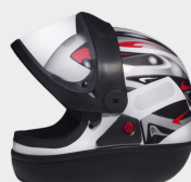
CAPACETE MOTO SAN MARINO 56/58/60/62