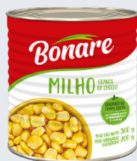
MILHO VERDE BONARE 200G