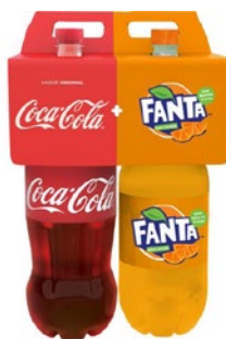
KIT COCA COLA/FANTA 2L