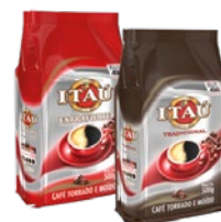
CAFÉ ITAÚ 500G