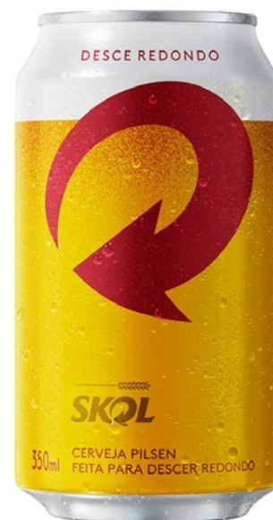
CERVEJA SKOL LATA 350ML