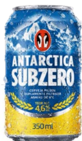
CERVEJA ANTARCTICA SUB- ZERO 350ML