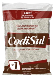
ARROZ CODISUL TIPO-1 5KG