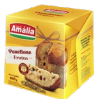
PANETTONE SANTA AMÁLIA 400G