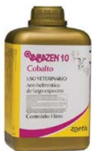
VALBAZEN 1L - ZOETIS