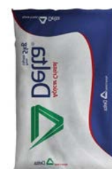
AÇÚCAR CRISTAL DELTA 5KG