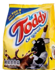
ACHOCOLATODO TODDY 1KG