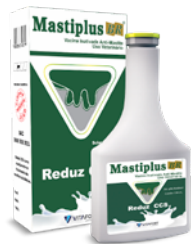
MASATIPLUS 100ML - VITAFORT