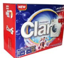
SABÃO EM PÓ CLARO 1,6KG