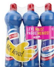
KIT MULTI USO AZULIN C/3