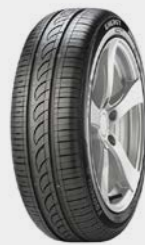
PNEU FORMULA 175/65 R14