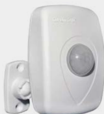
SENSOR DE PRESENÇA C/ FOTOCEL