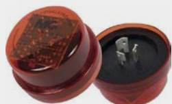
RELE FOTOELETRICO 2401 E 2402