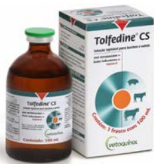
TOLFEDINE CS 100ML VETOQUINOX