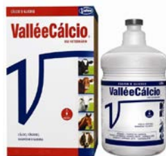
VALLÉCÁLCIO 250ML - VALLÉE