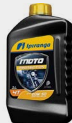
ÓLEO IPIRANGA MOTO 4 TEMPOS 20W50 SL 1L