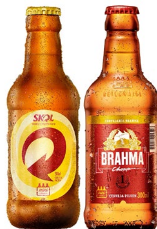
CERVEJA SKOL/BRAHMA 300ML RETORNÁVEL