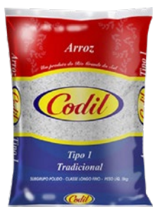
ARROZ CODIL TIPO-1 5 KG