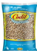
FEIJÃO CARIOCA CODIL TRADICIONAL 1KG