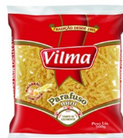
MACARRÃO VILMA PARAFUSO 500G