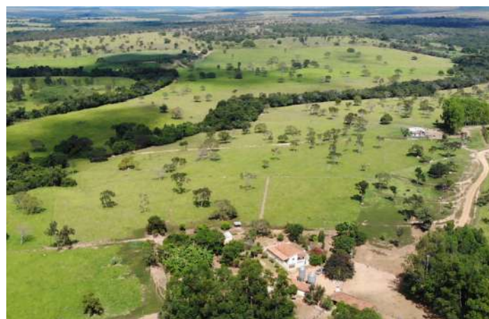
Vista aérea da Fazenda Santa Rosa do Pinho