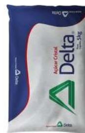
AÇÚCAR CRISTAL DELTA 5KG