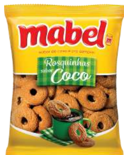
BISCOITO ROSQUINHA MABEL 800G