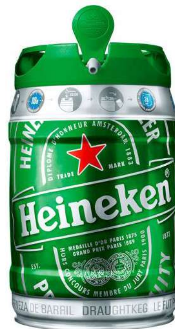
BARRIL CHOPP HEINEKEN 5L