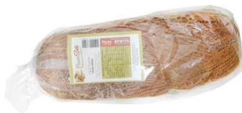
FATIA CASEIRA PANISSETE 500G