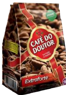
CAFÉ DO DOUTOR 500G