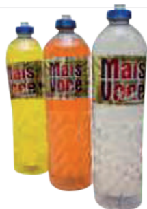
DETERGENTE MAIS VOCÊ FRAGÂNCIA 480ML