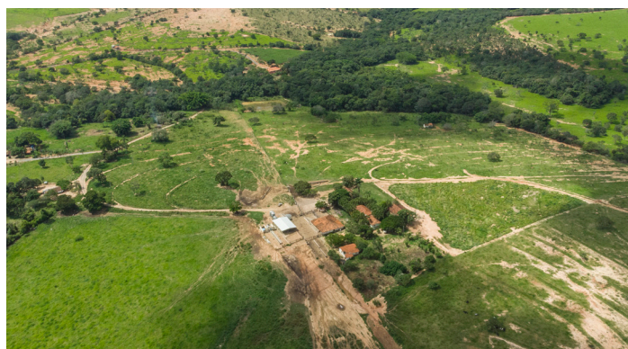
Vista aérea da Fazenda Barra Velha