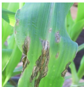
Figura 1 - Sintomas da antracnose foliar em plantas jovens de milho.

bom nível de resistência. Outras medidas como o uso de adubação equilibrada, principalmente quanto à relação nitrogênio/potássio, manejo correto de irrigação, manejo de pragas e plantas daninhas, uso de densidade de plantio recomendada para a região e para as cultivares, realização do plantio e da colheita em épocas adequadas devem ser consideradas para o manejo dessa enfermidade. Práticas que reduzam o potencial de inóculo do patógeno nos restos de cultura e no solo, como rotação de cultura e/ou de híbridos, são importantes para a diminuição da incidência da doença. Essas medidas, além de trazerem benefício imediato ao produtor por reduzir o potencial de inóculo dos patógenos presentes na lavoura, contribuem para maior durabilidade e estabilidade da resistência genética presentes nas cultivares comerciais por reduzirem a população de agentes patogênicos. A mais atrativa estratégia de manejo de doenças é a utilização de cultivares geneticamente resistentes, uma vez que o seu uso não exige nenhum custo adicional ao produtor, não causa nenhum tipo de impacto negativo ao meio ambiente, é perfeitamente compatível com outras alternativas de controle e é, muitas vezes, suficiente para o controle da doença. ☺