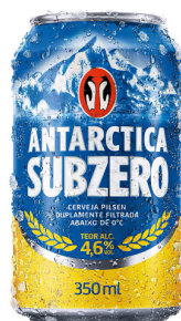
CERVEJA ANTARTICA SUB-ZERO 350ML