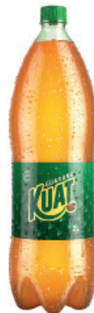
REFRIGERANTE KUAT 2L