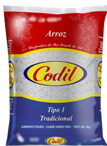
ARROZ CODIL TIPO-1 5 KG