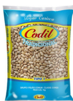
FEIJÃO CARIOCA CODIL TRADICIONAL 1KG