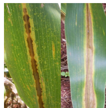
Figura 2 - Sintomas da antracnose na nervura e queima foliar em formato de “V” invertido em plantas de milho.