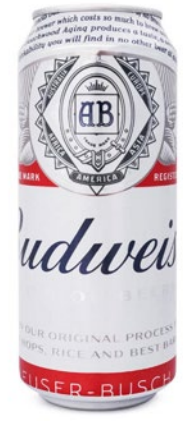
CERVEJA BUDWEISER 410ML