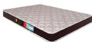
COLCHÃO CASTOR MAX 1.38X25 D33