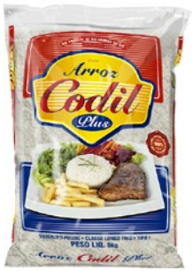
ARROZ CODIL PLUS T-1 5KG