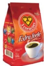
CAFÉ 3 CORAÇÕES 500G