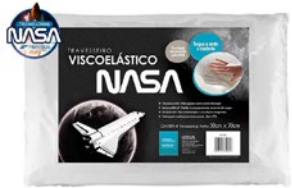
TRAVESSEIRO VISCO ELÁSTICO NASA 46X66CM