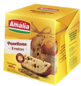
PANETTONE SANTA AMÁLIA 400G